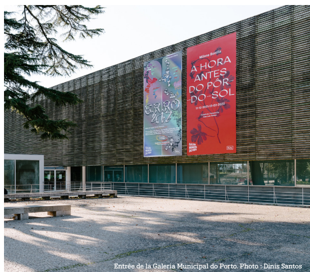
Entrée de la Galeria Municipal do Porto.

www.cccod.fr www.galeriamunicipaldoporto.pt